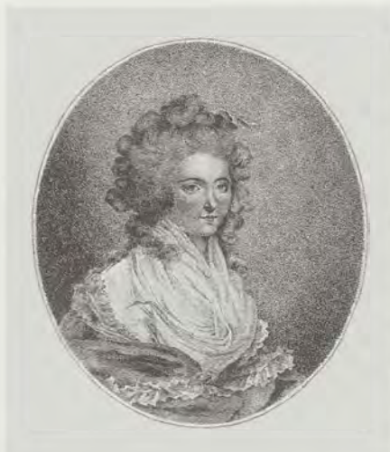
Serafina Lorenza Feliciana, Cagliostros Gattin. Anonymer Kupferstich

Unternehmungen zu einem grossen Teil aus Betrügereien bestanden, die – einmal aufgedeckt – ihn dazu zwangen, weiterzureisen und das Glück anderswo zu suchen. Erst zehn Jahre vor seinem Tod, im Jahre 1785, verwickelte er sich in eine Geschichte, von der er sich reputationsmässig nicht mehr erholen sollte, obschon er gerade daran wohl die geringste Schuld hatte: die Halsbandaffäre. Und die ging so: Der damalige Strassburger Fürstbischof Prinz Louis von Rohan wollte sein geringes Ansehen bei Marie Antoinette, der Königin Frankreichs, verbessern. Allem Anschein nach gab deshalb Cagliostro dem Bischof den Rat, dass die Königin ihm verzeihen werde, wenn er, Louis von Rohan, der Landesherrin behilflich wäre, sie in den Besitz des anderthalb Millionen Franken teuren Diamantenhalsbandes eines Juwelenhändlers zu bringen.