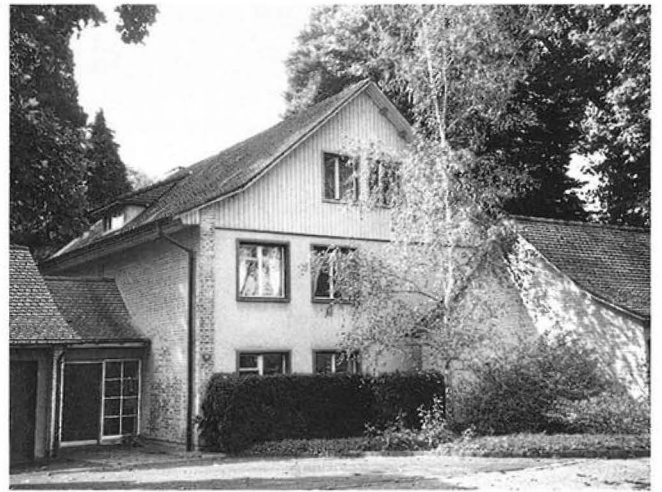
101. Wohnhaus Bachtelenweg 9. Aufnahme 1996.