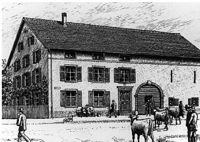
9. Haus Baselstrasse 1 (Wohnhaus links) und Baselstrasse 3 (Scheune und Stall rechts), zwischen 1911 und 1923.

(1872–1900: Haus- und Brandlager-Nr. 201; 1798–1872: Nr. 200)