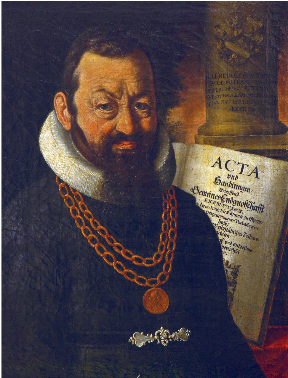
Anonym: Postumes Bildnis von Johann Rudolf Wettstein, Öl auf Leinwand, 40 × 33 cm, Mitte 18. Jahrhundert, aus dem Wettsteinhaus.