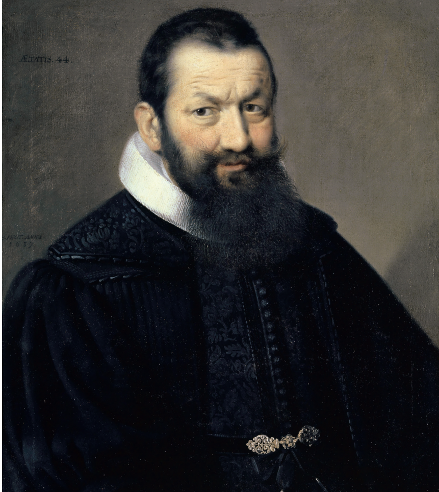
Samuel Hofmann: Bildnis Johann Rudolf Wettsteins, Öl auf Leinwand, 1639.

historiografischen Literatur offenbar lange Zeit kaum eine Rolle. Dies änderte sich erst 1731 mit dem Traktat «Die gerettete völlige Souveraineté der löblichen Schweitzerischen Eydgenoßenschaft». Darin versucht der württembergische Staatsrechtler Johann Jacob Moser (1701–1785) den Nachweis zu erbringen, dass die Eidgenossenschaft mit dem Westfälischen Frieden die volle Souveränität erlangt habe, auch wenn dieser Begriff in den Friedensverträgen nicht genannt wird. Als wichtigsten Beleg für diese Aussage zieht er eine Eingabe Wettsteins an den Kaiser vom 14./24. Februar 1647 heran, in der der Basler