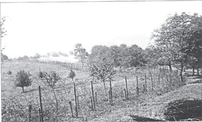
Diese Aufnahme zeigt den Grenzverhau in der Nähe der Wiese im Mattrain, während im Hintergrund der Tüllinger zu sehen ist.

Sollten sich noch lebende Personen auf diesen Bildern wiedererkennen und sich oder ihre Angehörigen in ihren persönlichen Belangen durch ihre Veröffentlichungen beeinträchtigt sehen, so bitten die Redaktion (E-Mail: redaktion.weil@badische-zeitung.de) und die Dokumentationsstelle Riehen (E-Mail: dokumentationsstelle@riehen.ch) um entsprechende Hinweise. Die ordentliche Schutzfrist für Personendaten beträgt zehn Jahre nach dem Todesdatum. Falls die Schutzfrist noch nicht abgelaufen ist, haben die Angehörigen ein Recht auf Anhörung.