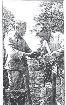
Beim Reichsarbeitsdienst taten ganz junge Männer Dienst.