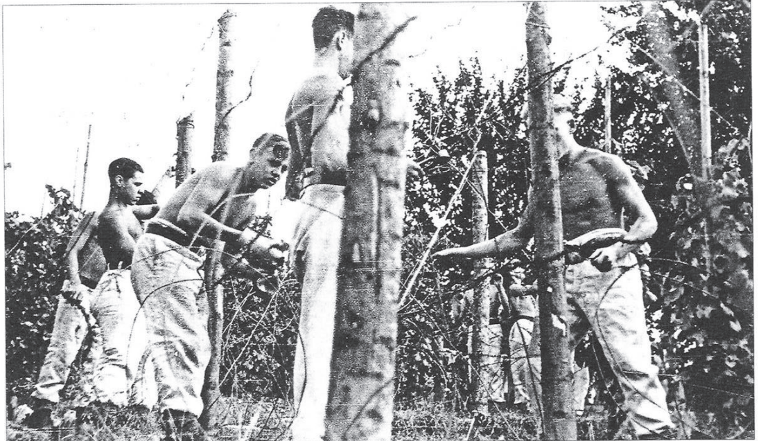
Mitglieder des Reichsarbeitsdienstes legen den Grenzverhau an.