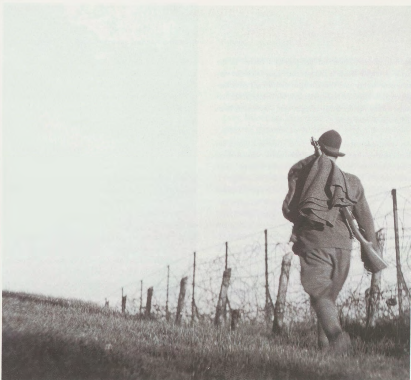
Grenzwächter auf Patrouille auf dem Lenzen bei Bettingen, Aufnahme 1945