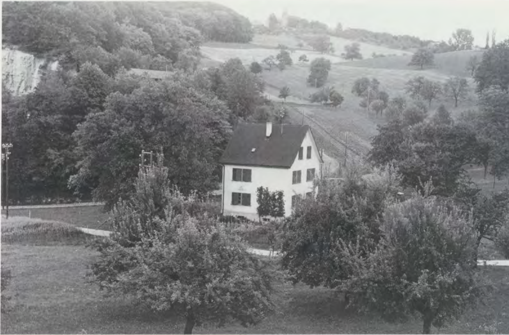
Das Zollhaus Bettingen, im Hintergrund das Chrischonakirchlein. Aufnahme um 1945

Zollaus und berichtete den Vorfall. Die Polizei wurde benachrichtigt. Sie rückte mit dem Überfallauto, einem vierplätzigem DKW ohne Seitentüren, aus und griff die drei Personen auf. Es waren französische Kriegsgefangene.