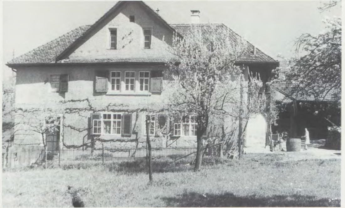
Bauernhof Schweizer an der Bäumligasse 6, am Ausgang des Autales. Viele Flüchtlinge kamen von der Au her und fanden hier Unterschlupf in Stall und Scheune. Aufnahme um 1940