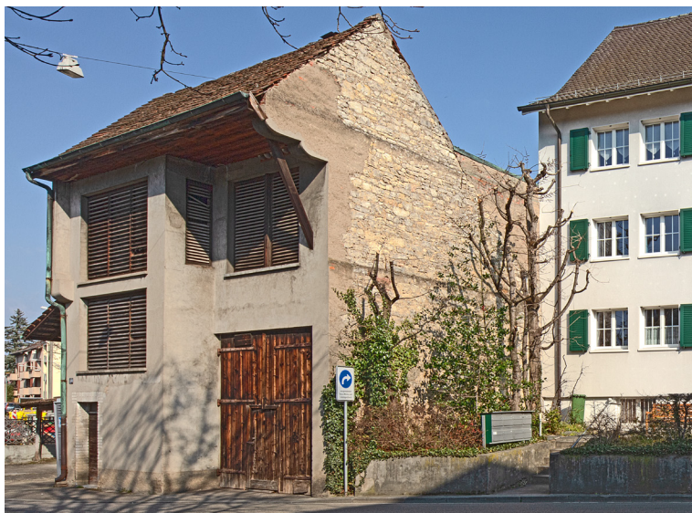
176. Rössligasse 46, rechte Seite des Gebäudes (2022).

Auch nach dem Abbruch des Bauernhauses Rössligasse 41 im Jahr 1966 führte Louis Vögelins Sohn Emil die Landwirtschaft in reduziertem Umfang weiter, sodass das Wirtschaftsgebäude Rössligasse 46 seine Funktion vorerst beibehielt. Heute erscheint es als anscheinend ungenutztes Relikt der längst aufgegebenen Landwirtschaft.