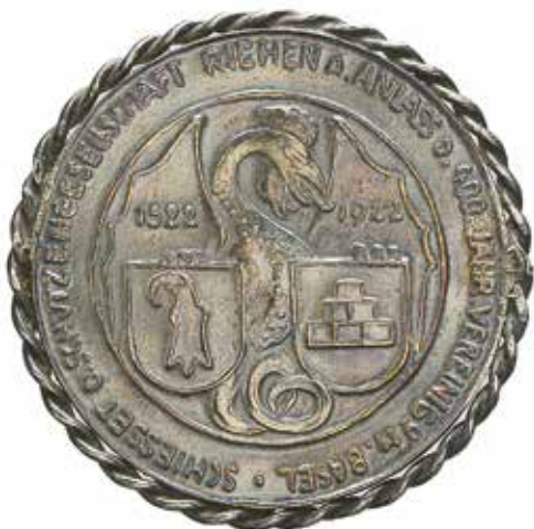
Rückseite der Medaille von Hans Frei zum Schiessfest der Schützengesellschaft Riehen anlässlich des Jubiläums «400 Jahre Vereinigung mit Basel» im Jahr 1922 (verschoben auf 1923).

seits Ausdruck der Spannungen zwischen den bürgerlichen und linken Parteien nach der Niederschlagung des Landesstreiks von 1918 und des Basler Generalstreiks von 1919, 39 andererseits stand dahinter die Absicht, Arbeitern die Gelegenheit zu verschaffen, zu möglichst günstigen Konditionen das «Obligatorische» zu schießen. Die Schützenvereine, namentlich die Schützengesellschaft, spielten denn auch bis zum Zweiten Weltkrieg politisch eine nicht unwichtige Rolle. Hier und in anderen führenden Vereinen wurde «abgesprochen [...], was in Riehen Brauch sein sollte». 40