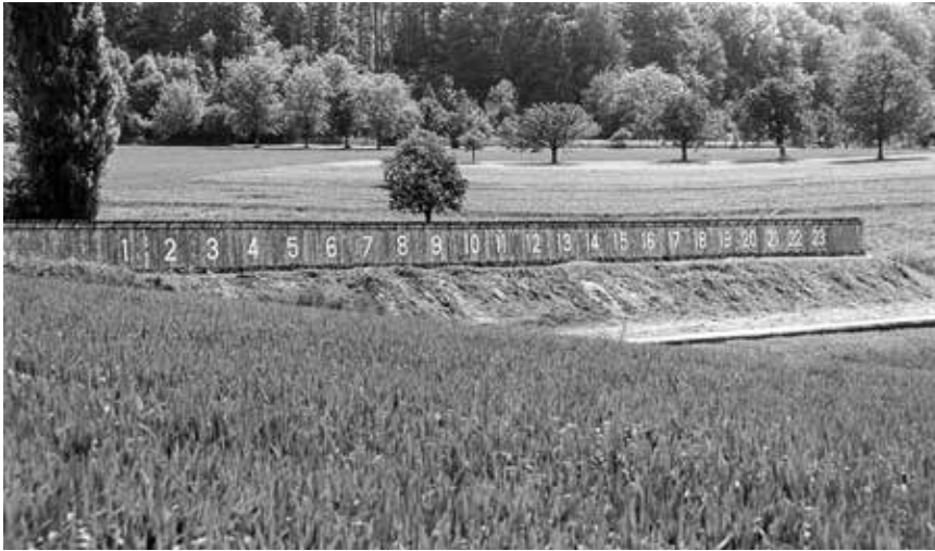
Blick auf die Zielscheiben des Schiessstands von Riehen. Aufnahme von 1992.

1898 veräusserte Riehen den Schiessstand an den Kanton Basel-Stadt und übergab diesem damit die Verantwortung für den Schiessbetrieb. 31 Dieser Verkauf fiel in eine Zeit, in der die Gemeinde eine ganze Reihe von Aufgaben, etwa das Schulwesen oder den Unterhalt des Wieseufers, an den Kanton abtrat, weil sie mit den damit verbundenen Kosten überfordert war. Dem Kanton ging es allerdings im Fall des Schiessstandes weniger darum, Riehen finanziell zu entlasten als den Städtern eine günstige Schiessgelegenheit zu verschaffen anstelle der «Schützenmatte», des damals stillgelegten Schiessplatzes vor der Stadt. 32 Der Kanton, der bereits den 1894 eingeweihten Scheibenstand mehrheitlich finanziert hatte, liess sogleich einen neuen Schiessstand mit Schiessrichtung längs des Chrischonawegs statt quer darüber errichten, der 1899 eingeweiht werden konnte. 33 Die Anlage wurde 1928 erweitert und 1957 modernisiert, nachdem noch 1953/54 intensive Diskussionen über eine Verlegung des Schiessplatzes an einen Ort auf weniger begerhtem Bauland geführt worden waren. 34